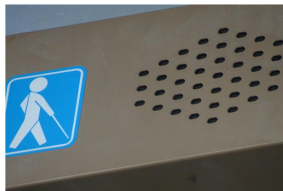
玄関の音声誘導サイン