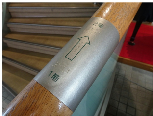
階段手すりの点字表示板