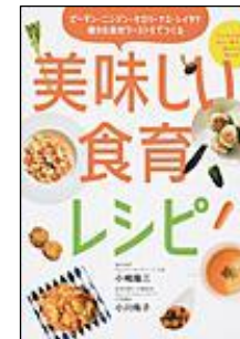
「美味しい食育レシピ」 小嶋 隆三/著 小川 侑子/著 現代書林