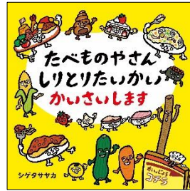
「たべものやさんしりとり たいかいかいさいします」 シゲタ サヤカ/著 白泉社