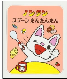
「ノンタン スプーン たんたんたん」 キヨノ サチコ/作・絵 偕成社