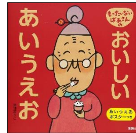
「もったいないばあさんの おいしいあいうえお」 真珠 まりこ/作・絵 講談社