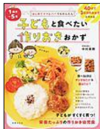
「子どもと食べたい 作りおきおかず」 中村 美穂/著 世界文化社