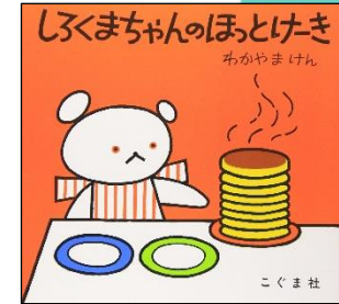
「しろくまちゃんのほっとけき」 わかやま けん/え 森 比左志/著 わだ よしおみ/著 こぐま社