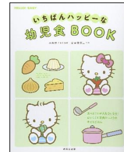
「いちばんハッピーな 幼児食 BOOK」 成美堂出版