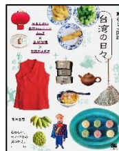
「台湾の日々」 青木 由香 著 翔泳社