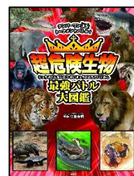
「超危険生物 最強バトル大図鑑」 宝島社

「おべんとうばあ!」 のぶちか めばえ 作 講談社 「鬼滅の刃 7」 吾峠 呼世晴 原作・絵 集英社