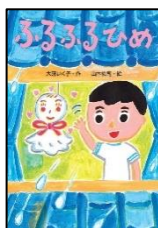
「ふるふるひめ」 大窪 いく子 作 山本 祐司 絵 文研出版