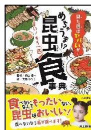
「めちゃうま!」 昆虫食事典」 大泉書店