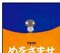
「めをさませ」 五味 太郎 作 絵本館