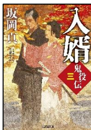
「入婿」 坂岡 真 著 光文社