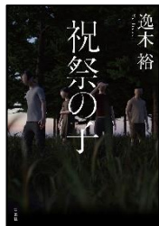
「祝祭の子」 逸木 裕 著 双葉社