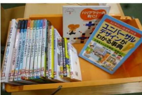
テーマに合わせて選書・運搬「調べ学習貸出」