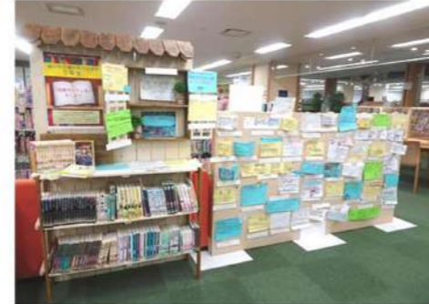
「調べ学習支援」POP作成指導・作品の展示