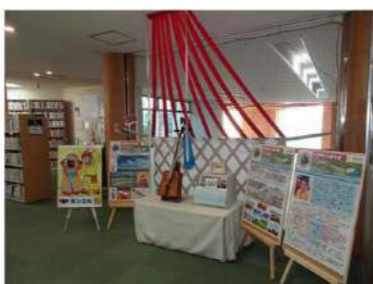
国際交流協会との連携