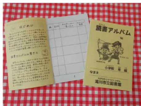
読書記録を残す「読書アルバム」