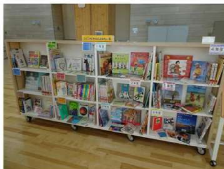
「学校図書館運営支援」授業で使える本のコーナー