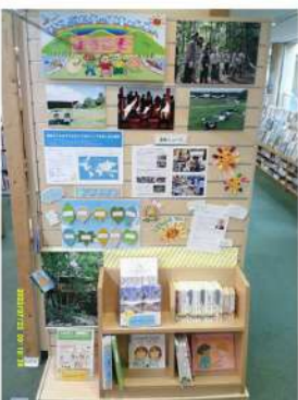
そらぷちキッズキャンプとの連携