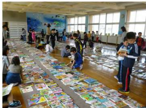
全小・中学校で実施の「図書館学級文庫」