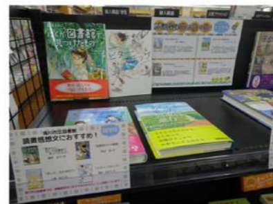
書店員と図書館員が読書感想文におすすめの本の紹介チラシ作製、書店と図書館でコーナー設置