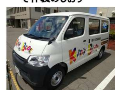
図書館の運搬車もご寄贈