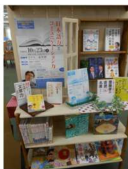
生涯学習振興会との連携