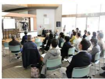
國學院大學北海道短期大学部との連携