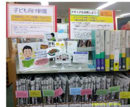
メディアを活用した調べ学習を推奨テーマ別で新聞を配置