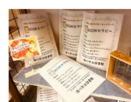
「全国BOOKセラピーネットワーク」滝川市発案、全国50カ所を超える公共・学校図書館が参加5つの症状にピッタリの本を展示