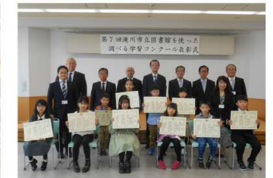
企業や報道機関が協賛し賞を増設子ども達のやる気につながっている