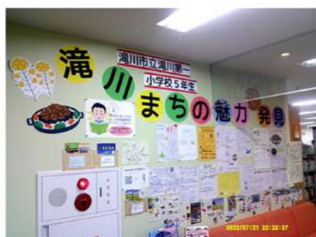
「調べ学習支援」成果発表の場として活用