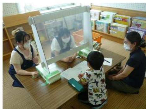
調べたいテーマに合わせた相談窓口「夏休み☆調べる窓口」