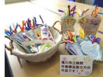
市立病院作業療法室で作製のしおり