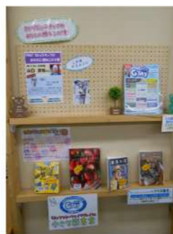
FMなかそらちとの連携