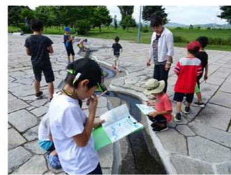
関連施設・機関と連携し、郷土の財産・資源・取組を知り、体験を通して学びを深める「たきかわDE調べる学習体験講座」川コース・空コース・介護コース