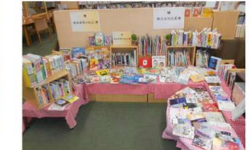
ご寄付いただいた本はコーナーを作って展示でお披露目