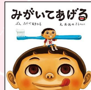
「みがいてあげる」 ふくべ あきひろ 文 おおの こうへい 絵 教育画劇