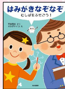
「はみがきなぞなぞ」 平田 昌広 作 オカダ ケイコ 絵 あかね書房