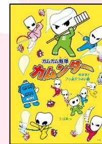
「カムカム戦隊 カムンダー」 こばあつ 著 みらいパブリッシング