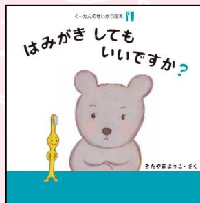
「はみがきしてもいいですか？」 きたやま ようこ 作 あすなろ書房