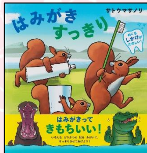
「はみがきすっきり」 サトウ マサノリ 作・絵 パイインターナショナル