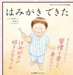
「はみがきできた」 北川 真理子 作 森 碧 絵 日本能率協会 マネジメントセンター