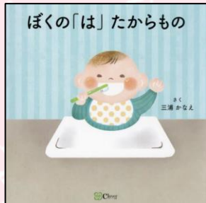
「ぼくの『は』たからもの」 三浦 かなえ 著 Clover 出版