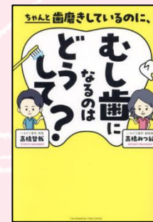
「ちゃんと歯磨きしているのに、 むし歯になるのはどうして？」 高橋 哲哉、高橋 みつ紀 著 クロスメディア・パブリッシング