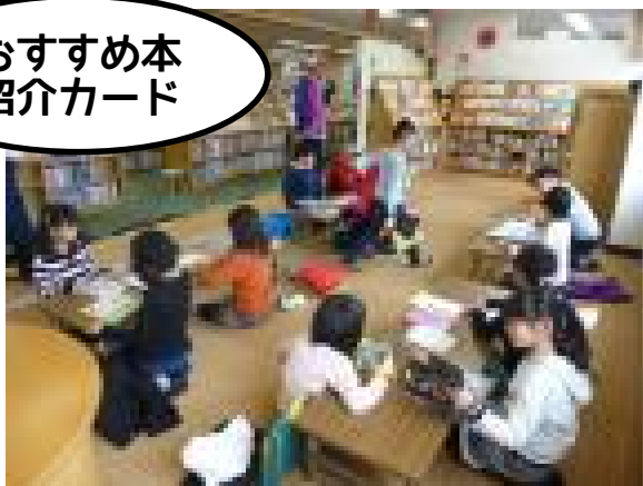
おすすめ本 紹介カード