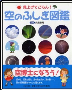
「空のふしぎ図鑑」 PHP研究所