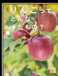
「りんごって、 どんなくだもの？」 安田守 写真・文 岩崎書店