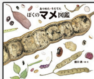
「あつめた・そだてた ぼくのマメ図鑑」 盛口満絵 文 岩崎書店