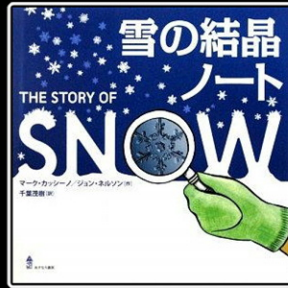
「雪の結晶ノート」 マーク・カッシーノ、 ジョン・ネルソン 作 あすなる書房