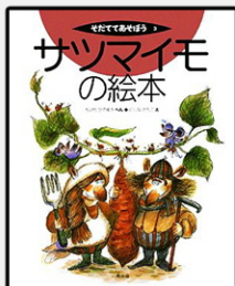
「サツマイモの絵本」 たけだひでゆき 編 にしなさちこ 絵 農山漁村文化協会