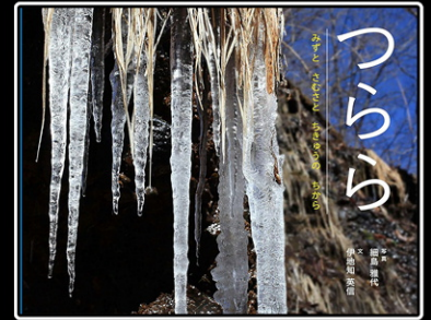
「つらら」 細島雅代 写真 伊地知英信 文 ポプラ社