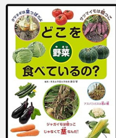
「どこを食べているの？ 野菜」 藤田智 編著 汐文社